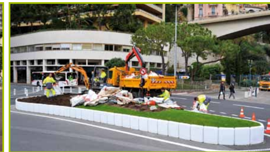
La Section Jardins de la Direction de l'Aménagement Urbain élague les Pins Quai Albert I er et déplace le terre-plein floral de la Place Ste Dévote.