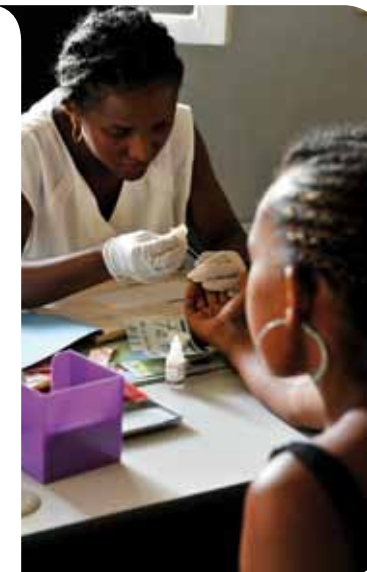
Action de dépistage du Paludisme menée dans le cadre de la lutte contre les pandémies et maladies négligées ; domaine d'intervention prioritaire du Gouvernement Princier au travers de la DCI.

La Santé a toujours été un domaine d'action prioritaire pour Monaco. Au niveau national, la Principauté au travers du Département des Affaires Sociales et de la Santé vise une politique d'excellence dans ce domaine.