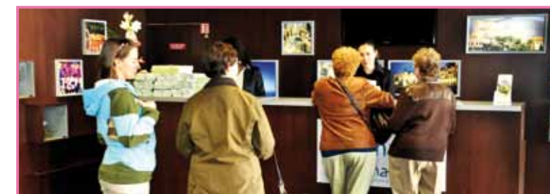
Accueil Cruise Bureau au Terminal Croisière

• Participation aux salons spécialisés tel que le Salon Seatrade de Miami en mars dernier.