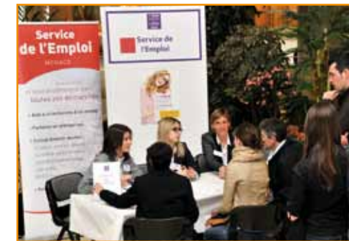
Stand du Service de l'Emploi au 1 er Forum de la Formation en Alternance et de la 6 e rencontre des Métiers de la Banque et de la Finance

Le 1 er Forum de la Formation en Alternance et la 6 e Rencontre des Métiers de la Banque et de la Finance se sont déroulés le 4 avril dernier à l'Auditorium Rainier III.