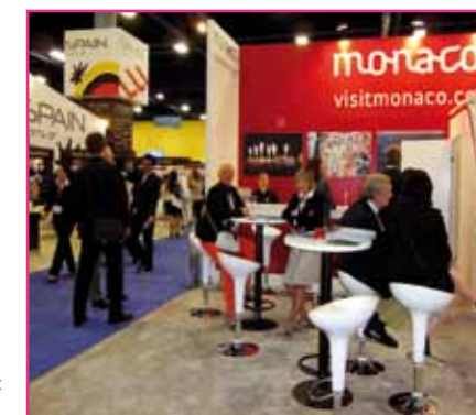
Salon Seatrade de Miami en Mars 2012

Les résultats ne se sont pas fait attendre avec une augmentation de 100 % du nombre de passagers du segment Luxe entre 2011 et 2012. L'évolution principale réside donc dans l'importante progression qualitative du type d'unités reçues, mieux en adéquation avec le positionnement touristique de la Principauté.