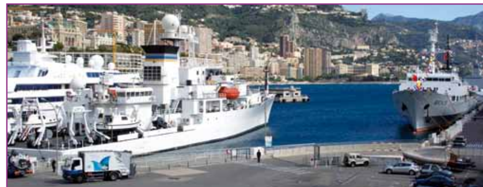
Des navires hydrographiques amarrés dans le Port de Monaco à l'occasion de la Conférence (venant de Chine, Espagne, Russie, USA et une frégate de la Marine française)