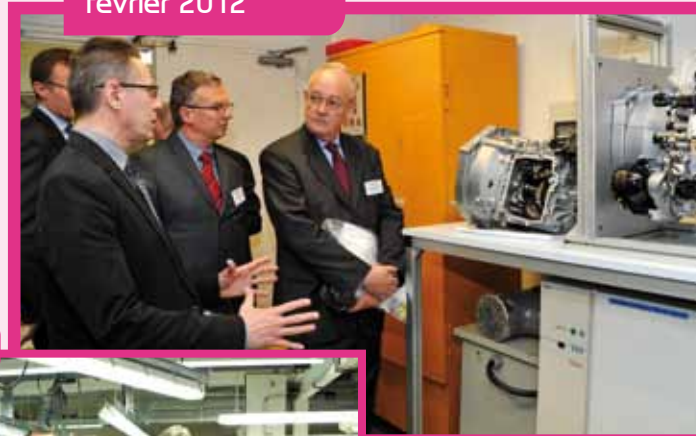
Le Ministre d'État en visite à Borgwamer Monaco, société spécialisée dans la conception et de la fabrication d'électrovalves haute pression.