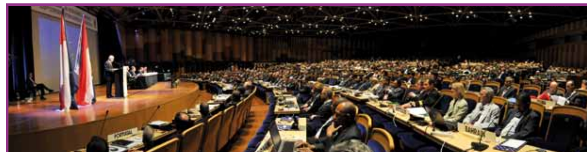
Les 300 délégués de la Conférence (80 pays)

Dans la perspective de ces élections, la DAI et la DAM ont travaillé ensemble pour la réception et l'analyse des candidatures. Si la DAI étudie les aspects politiques de la candidature, la DAM en examine les aspects techniques. Une sélection de candidats a ensuite été soumise à S.A.S. le Prince Souverain pour déterminer les candidatures appuyées par la Principauté.