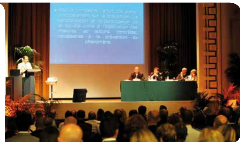
Séminaire d'information et de sensibilisation de juin 2010

Présentée dans le JDA n°31, l'Ordonnance Souveraine du 29 août 2011 régissant la relation entre Administration et Administré a fait l'objet d'articles expliquant les recours administratifs préalables et la médiation (JDA n°32) ainsi que les Archives de l'État (JDA n°36).