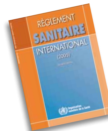
Règlement Sanitaire International 2005. La DAI a participé aux travaux de rédaction de ce document.

Au niveau de ses contributions volontaires, Monaco fait partie, depuis 2010, d'un petit groupe de pays cité en exemple car versant, une partie ou totalité de ses contributions de façon totalement non affectée et/ou des contributions « hautement flexibles ». La priorité accordée aux actions de l'OMS a reçu une nouvelle traduction en 2007 par la signature d'un Accord-cadre de coopération avec comme axe principal de coopération l'aide directe aux pays notamment dans la lutte contre les maladies négligées et aux conséquences du changement climatique sur la santé.