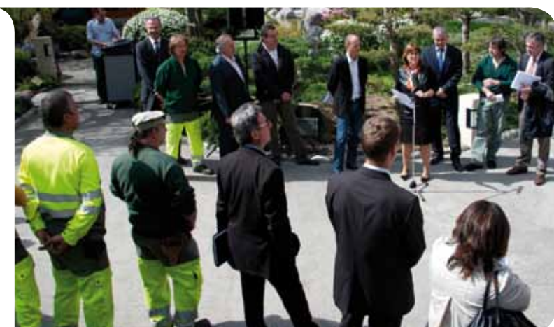
Cérémonie de remise du Label EVE à la Section Jardins de la Direction de l'Aménagement Urbain au Jardin Japonais.